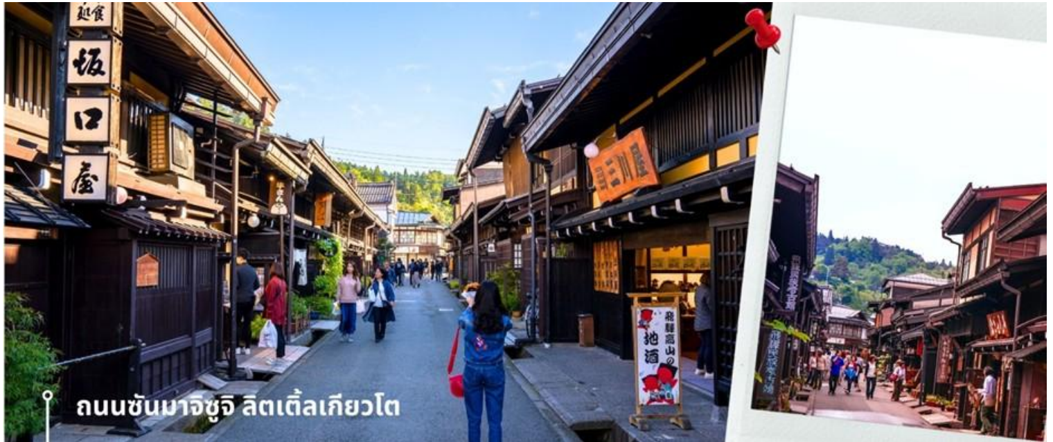
ถนนซันมาจิซุจิ ลิตเติลเกียวโต

หลังรับประทานอาหารเที่ยงนำท่านเดินทางสู่ เมืองทาคายามา ซึ่งเป็นเมืองเล็กๆ ที่ตั้งอยู่ในจังหวัดกิฟุ ที่ห้อมล้อมไปด้วยภูเขาและธารน้ำใส ให้เวลาท่านเดินเล่นสัมผัสบรรยากาศสวยงามกันที่ ถนนซันมาจิซุจิ ซึ่งถูกขนานนามว่าเป็น “ ลิตเติลเกียวโต ” บ้านไม้โบราณโชน้ำตาลดำ เรียงรายไปตามทางเดิน มีคูน้ำอยู่รอบเมือง ต้นไม้ร่มรื่นอยู่เป็นระยะ ปัจจุบันได้มีการปรับเปลี่ยนเป็นร้านค้า ร้านอาหาร ของที่ระลึก สำหรับนักท่องเที่ยวให้ได้เลือกชมทั้ง ผ้าแฮนด์เมด ชูดยูกาตะ