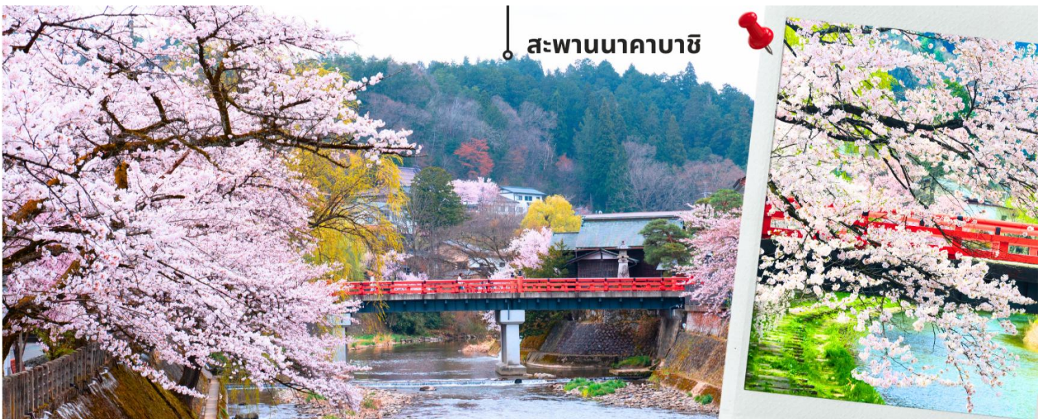
สะพานนาคาบาชิ

จากนั้นพาท่านแวะถ่ายรูปและชมวิถีที่ สะพานนาคาบาชิ เป็นสะพานที่สามารถเห็นได้ชัดอย่างโดดเด่นจากสีที่แดงเข้ม อีกทั้งสะพานแห่งนี้ยังถือเป็นสัญลักษณ์ที่สำคัญจุดหนึ่งของเมือง โดยเฉพาะใบไม้เปลี่ยนสีที่จะมีใบไม้สีสันสดใสสะพรั่งอยู่รายล้อมตัวสะพาน จนกลายเป็นจุดชมวิวยอดนิยมแห่งหนึ่งของเมืองทาคายามา