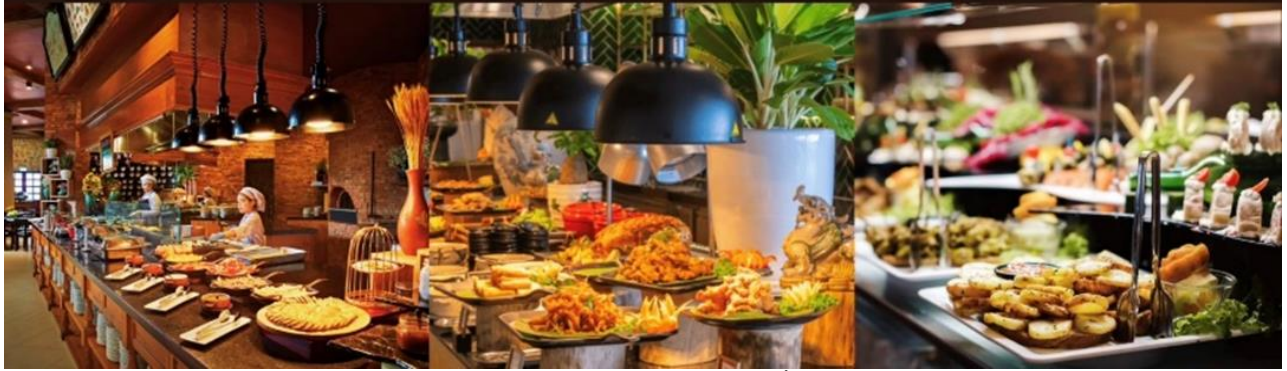
หน้า 5 (ภาพใช้เพื่อการโฆษณาเท่านั้น)

สำหรับท่านต้องการซื้ออาหารกลางวัน แบบบุฟเฟ่ต์นานาชาติด้านบนบานาฮิลล์เพิ่มเติม **ค่าอาหาร BUFFET ประมาณ 600 บาท / ท่าน**